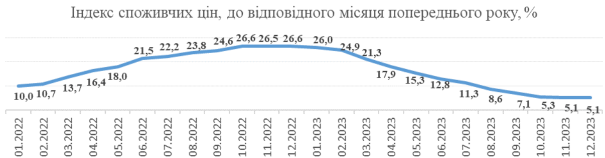
Рис. 1. Індекс споживчих цін, до відповідного місяця попереднього року, %

Рівень інфляції в Україні за 2023 р. сягнув 5,1 % 1 . За даними Державної служби статистики України, у грудні 2023 р. споживча інфляція в річному вимірі (р/р) залишилася на рівні попереднього місяця та становила 5,1 %. У місячному вимірі (відносно листопада) ціни зросли на 0,7 % (рис. 1).