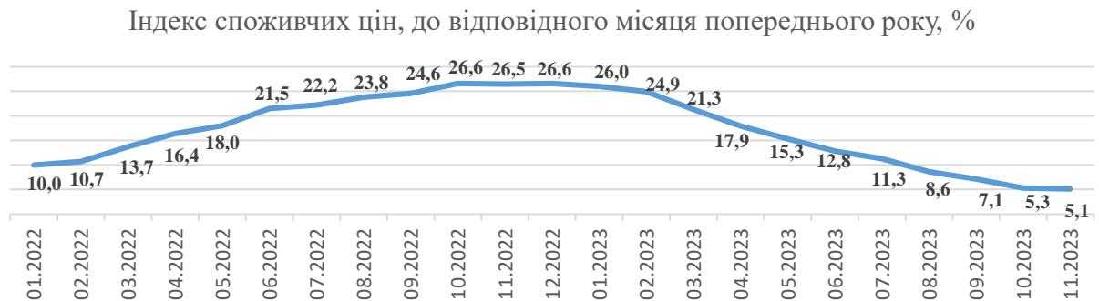
Рис. 1. Індекс споживчих цін, до відповідного місяця попереднього року, %

інфляція в річному вимірі (р/р) сповільнилася до 5,1 % з 5,3 % у жовтні (рис.1). У місячному вимірі (відносно жовтня) ціни зросли на 0,5 %. Зниження темпів цінового зростання у річному вимірі у листопаді пояснюється, зокрема, високою базою порівняння.