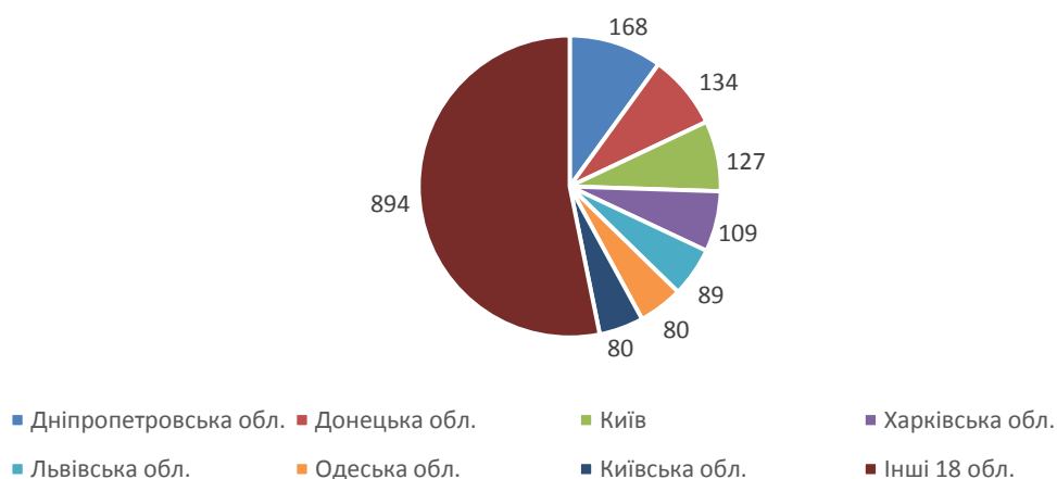
Рис. 2. Видатки на соціально-економічний розвиток окремих регіонів у 2020р., млн. грн.

(за даними Державної казначейської служби України, за 2020 р. фактичні дані наведено станом за січень-листопад, URL: https://www.treasury.gov.ua/ua/file-storage/vikonannya-derzhavnogo-byudzhetu )