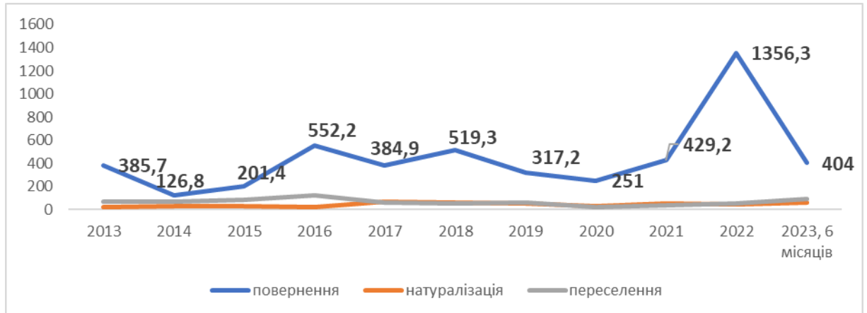
Рис. 1. Реалізація тривалих рішень щодо біженців, тис. осіб

Попри політичні декларації щодо переваг повернення як тривалого рішення для біженців, його масштаби, порівняно із загальною кількістю вимушених мігрантів (на середину 2023 р. у світі нараховувалося 36,4 млн біженців, тобто осіб, які вимушено залишили свої країни), доволі скромні (рис. 1).