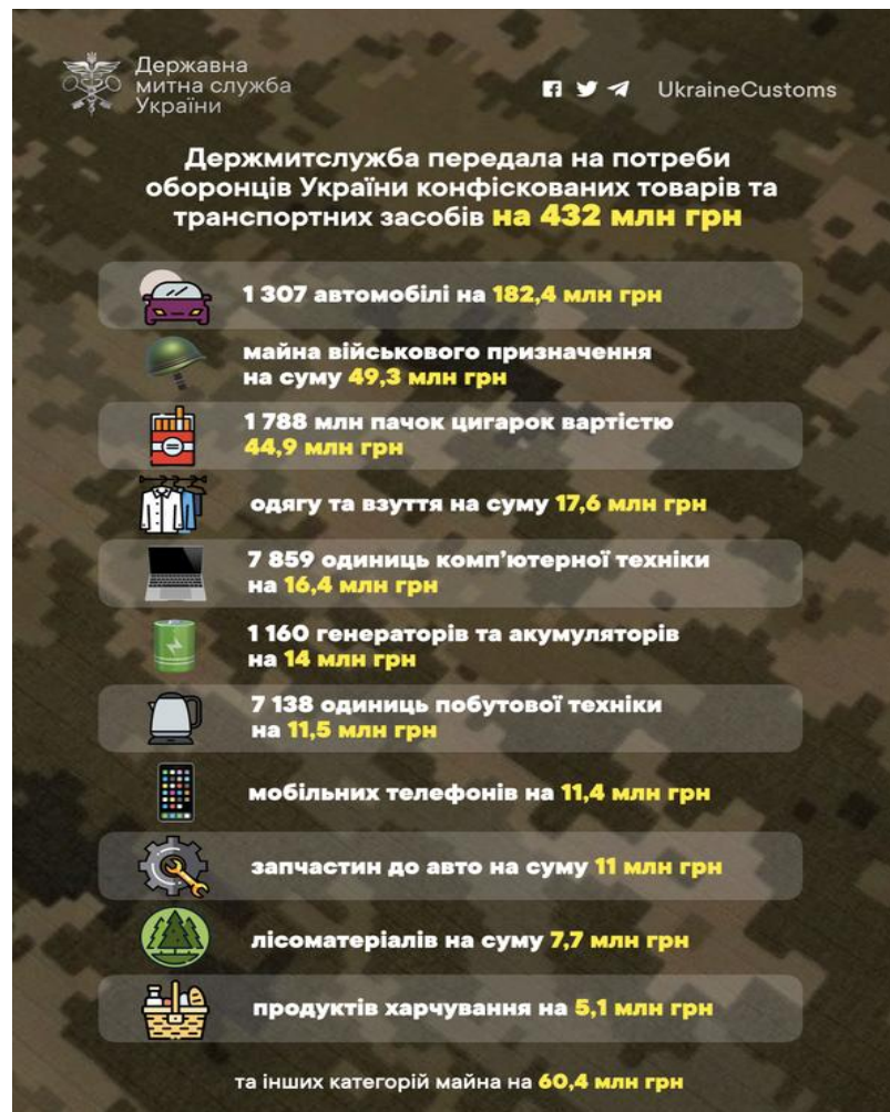
Рис. 3. Обсяги переданого Державною митною службою України майна для потреб Збройних Сил України (на 27.06.2023 р.)

Конфісковане майно (і таке, що на інших законних підставах перейшло у власність держави) передають Збройним Силам України та правоохоронним органам згідно з розпорядженням КМУ «Про передачу майна для потреб Збройних Сил» від 26.02.2022 р. № 186-р, постанови КМУ «Про внесення змін до деяких постанов Кабінету Міністрів України щодо передачі майна для задоволення потреб функціонування держави в умовах воєнного стану» від 16.09.2022 р. № 1043, а також відповідно до рішень військового командування щодо примусового відчуження або вилучення майна, ухвалених на підставі приписів Закону України «Про правовий режим воєнного стану» від 12.05.2015 р. № 389-VIII.