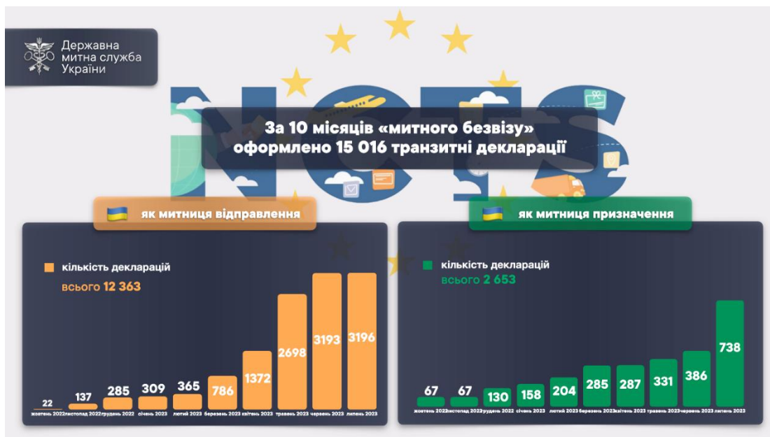
Рис. 2. Результати за 10 місяців застосування «митного безвізу» з 1 жовтня 2022 р. 2

Верховна Рада України схвалила 13.07.2023 р. та Президент України підписав 26.07.2023 р. зміни до Митного кодексу України для скорочення часу проходження митниці користувачами NCTS і розширення застосування транзитних спрощень. Змінами запроваджено можливості здійснювати внутрішній транзит товарів з використанням NCTS – за аналогією з транзитом, передбаченим Митним кодексом ЄС. Окрім того, створено законодавче підґрунтя для пріоритетного пропуску через кордон товарів, уміщених під процедуру спільного транзиту. Отже, прийняті зміни до Митного кодексу створюють сприятливі умови для українського бізнесу відкривати декларації T1 у внутрішніх митницях, що в поєднанні з електронною чергою на кордоні розвантажить пункти пропуску та скоротить час проходження митниці користувачам NCTS.