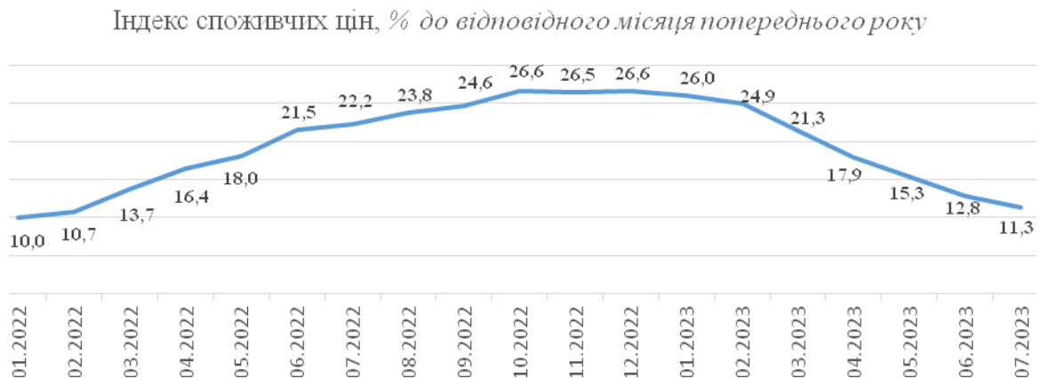
Рис. 1. Індекс споживчих цін, % до відповідного місяця попереднього року Джерело: НБУ, Держстат України.

Рівень інфляції в Україні знижується сьомий місяць поспіль 1 . За даними Державної служби статистики України, у липні 2023 р. споживча інфляція у річному вимірі (р/р) і далі уповільнювалася – до 11,3 % р/р з 12,8 % р/р у червні. Стримання інфляції зумовлювалося більшою пропозицією сирих продуктів харчування, а також сприятливою ситуацією на валютному ринку та поліпшенням інфляційних очікувань щодо цін на окремі товари, насамперед імпортовані (рис. 1).