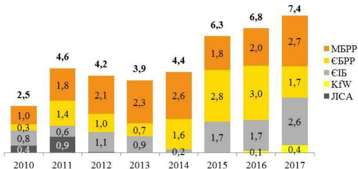
Рис. 4. Вибірка коштів позик МФО до спеціального фонду державного бюджету за 2010– 2017 рр. млрд грн.