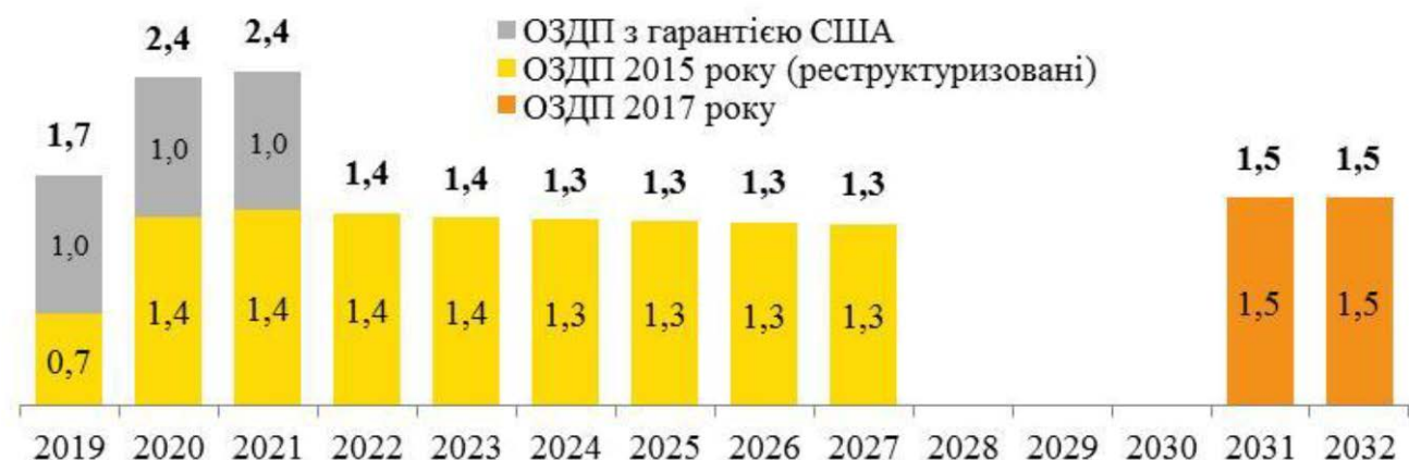
Рис. 3. Платежі з погашення ОЗДП (до та після обміну/викупу ОЗДП) (млрд дол. США)